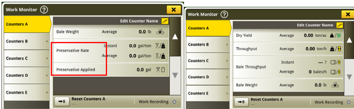
Visible frente a oculto